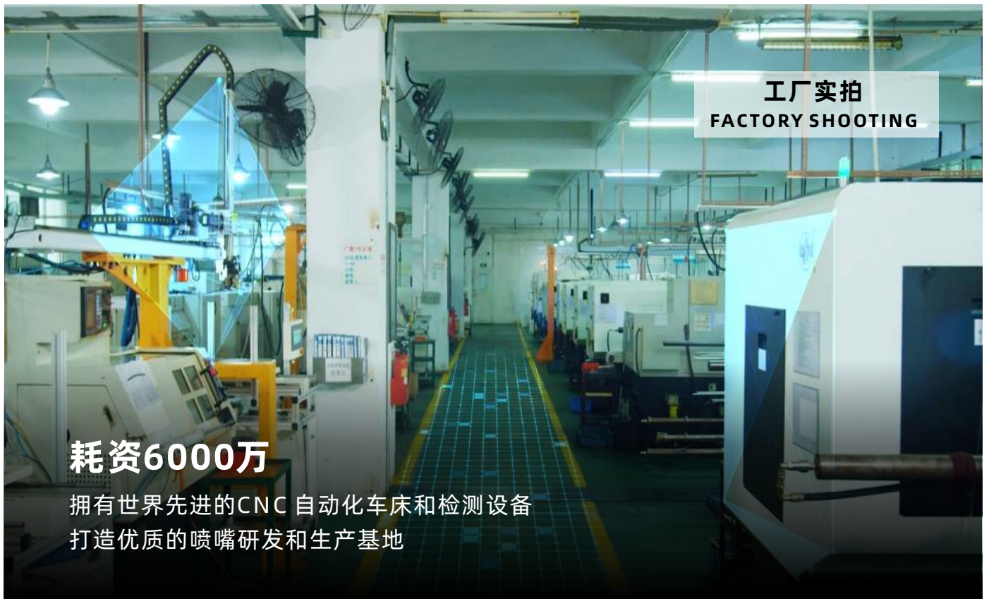
工厂实拍 FACTORY SHOOTING