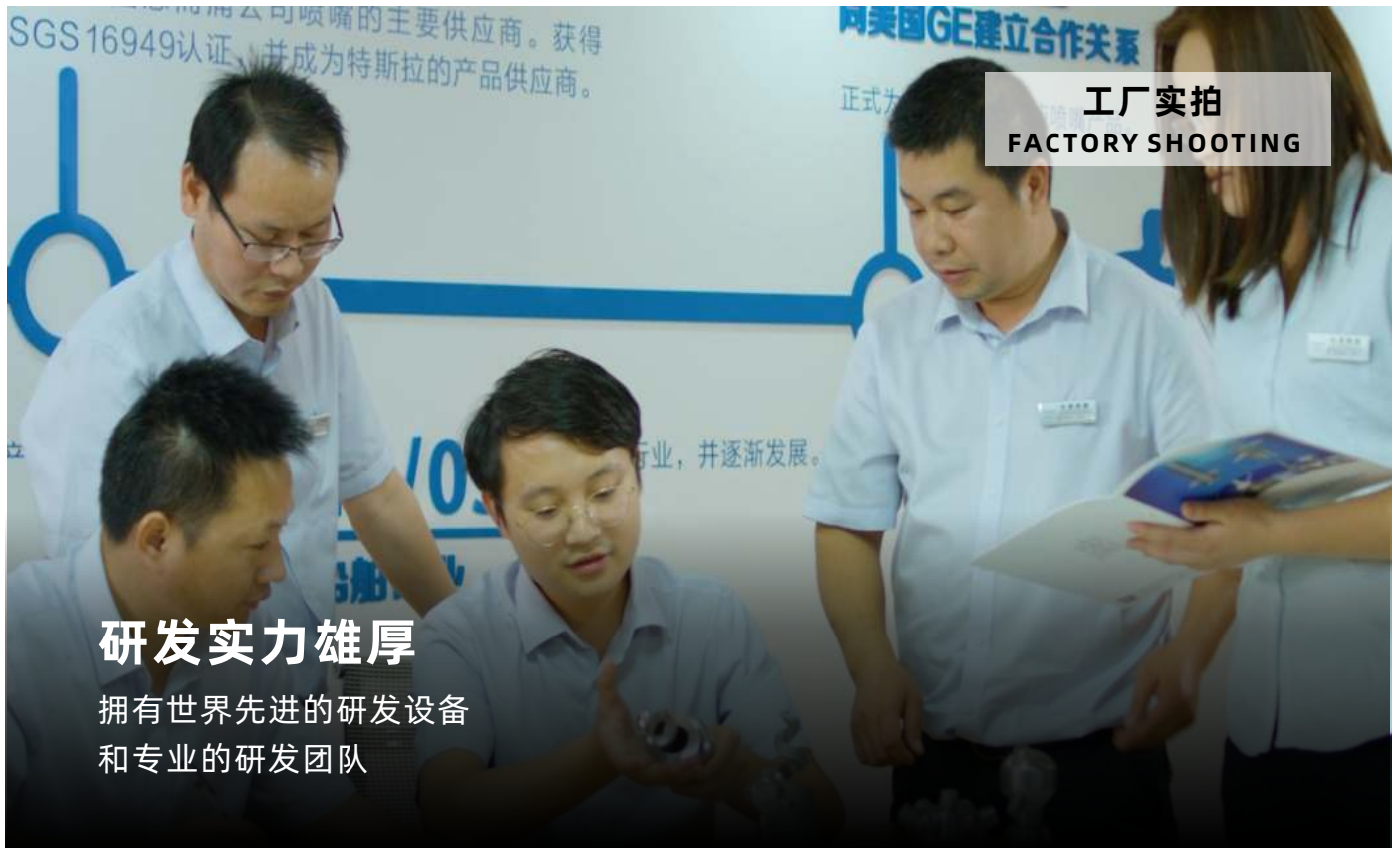
工厂实拍 FACTORY SHOOTING